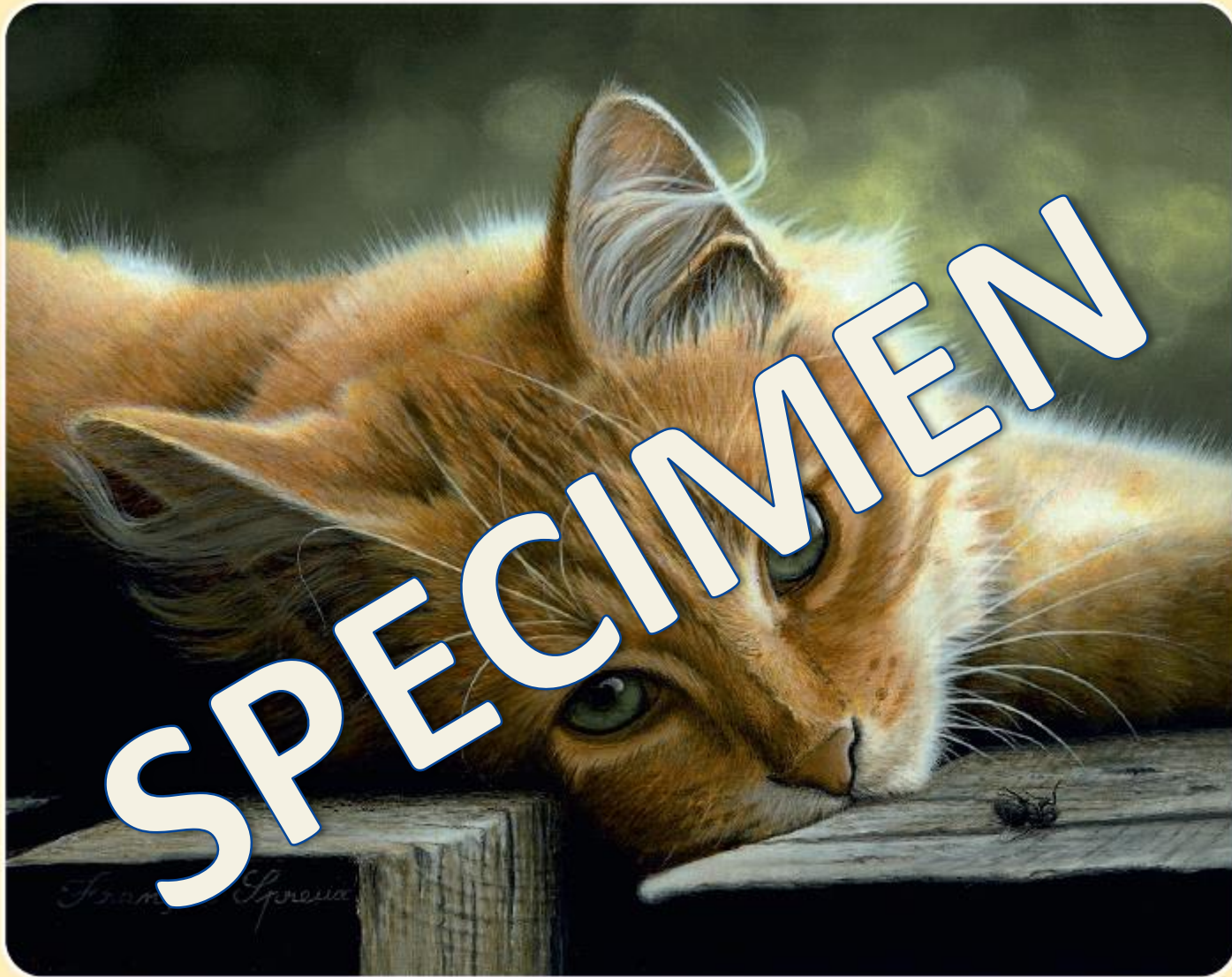
Après la chasse