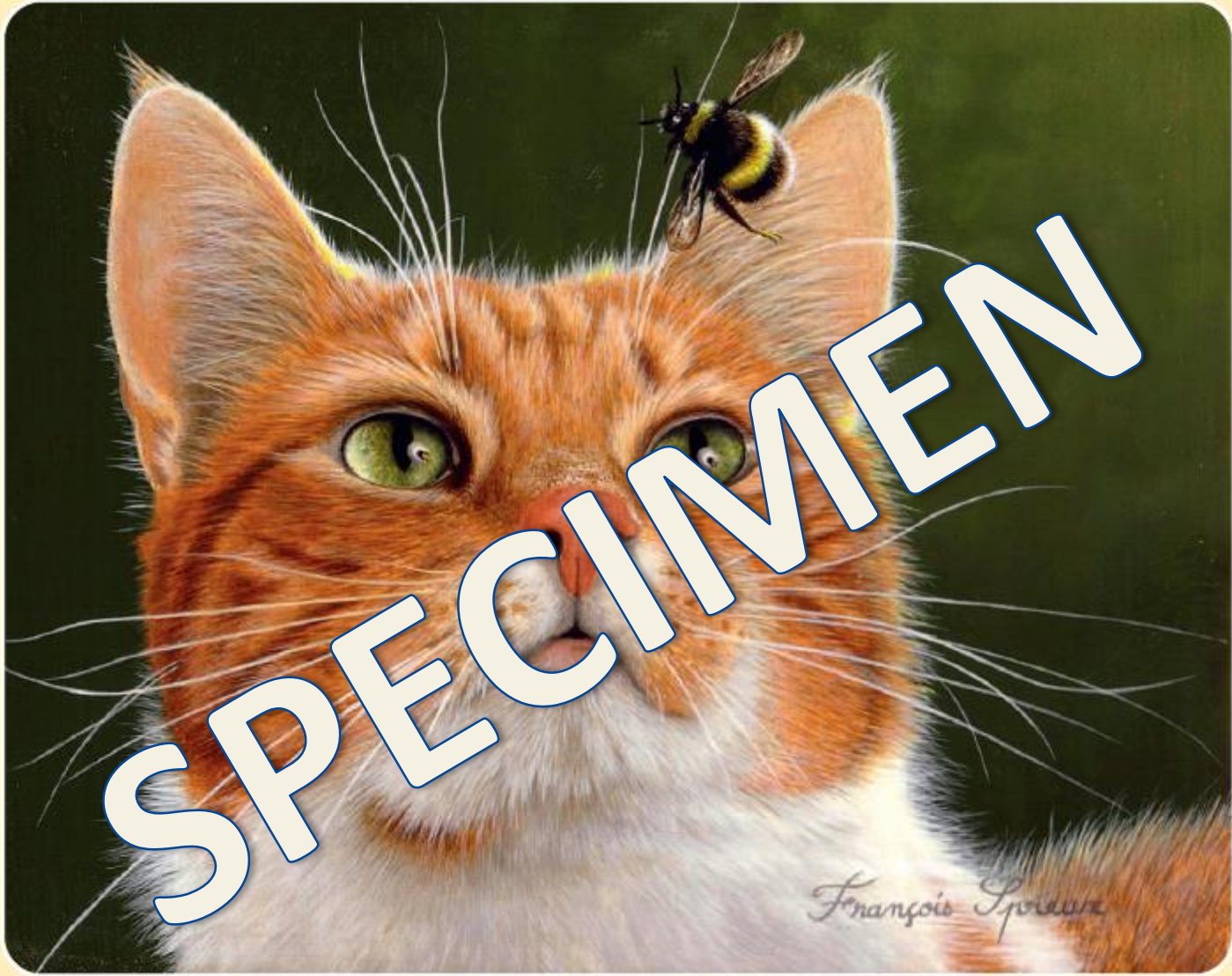
Le chat et le bourdon