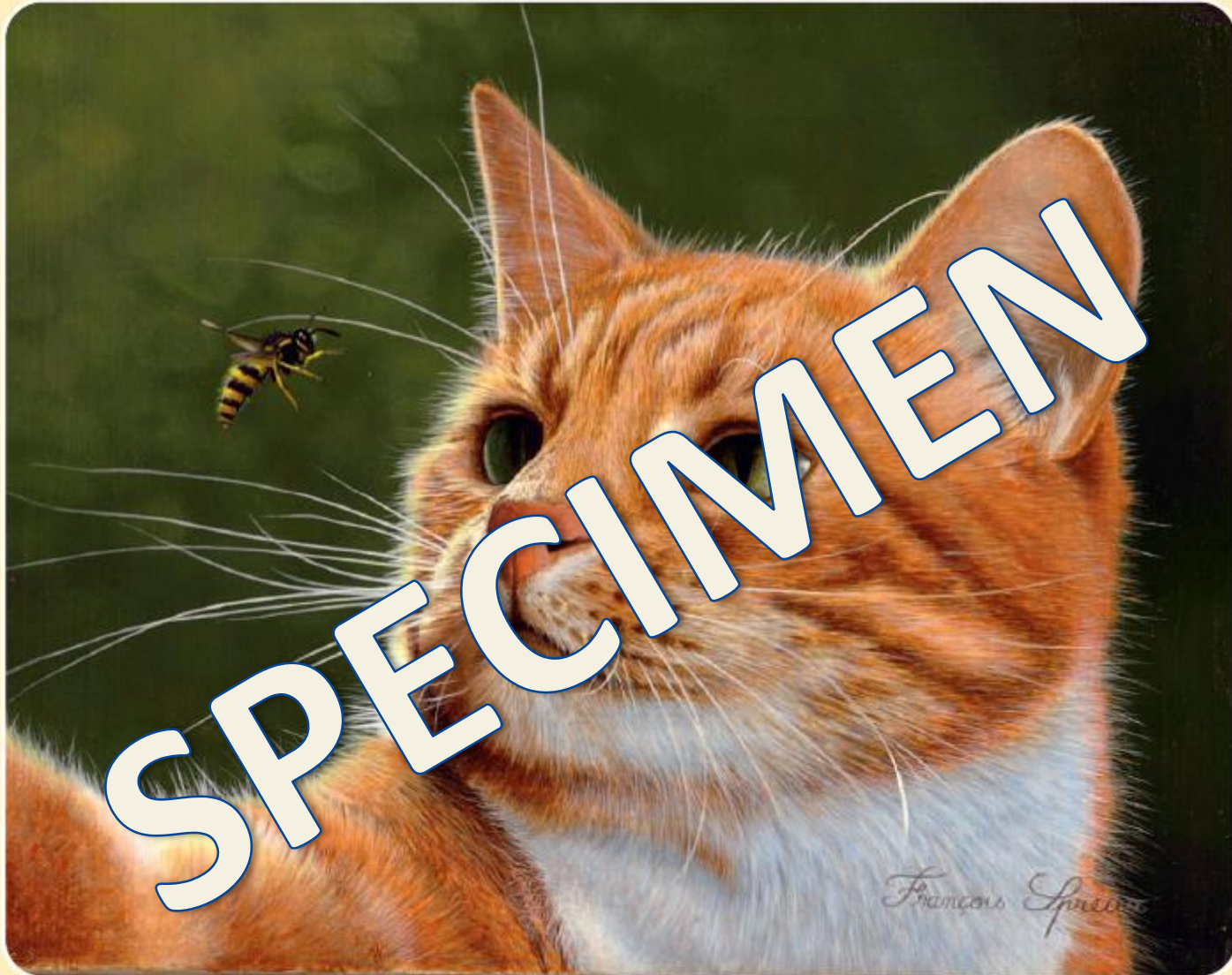
Le chat et la guêpe